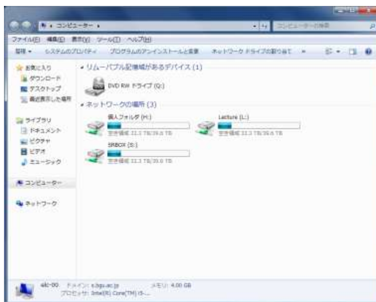
図 2-3 「コンピュータ」ウィンドウ

これらのフォルダは、すべてファイルサーバの中にあります。では、このウィンドウを出発点として、担当の先生の Lecture フォルダと SRBOX フォルダへのショートカットを作ることしましょう。提示用フォルダへのショートカット：上図の Lecture(L:) ドライブをダブルクリックして担当教員名が並んでいるウィンドウ（図 2-4 参照）が開くと、自分の担当教員（例えば「櫻山」）のフォルダ上で右クリックして、現れたショートカットメニューから「ショートカットの作成」を選んでクリックし、できたショートカットをドラック&ドロップで自分のデスクトップにコピーします。それをダブルクリックしたら直ちに担当教員の Lecture フォルダが開かれるかどうか確認しましょう。次に、そのアイコン上でまた右クリックして、ショートカットメニューから「名前の変更」を選び、望むフォルダ名（例えば「櫻山提示」）に書き換えます。最後に、デスクトップの背景の上で右クリックし、「アイコンの整列」→「アイコンの自動整列」（もちろん他の整列方法でも良い）と選び、