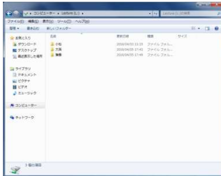
図 2-4 教員の Lecture フォルダ

アイコンを整列させておきましょう。(作成できない場合は、先生に作成してもらってからコピーしましょう)。